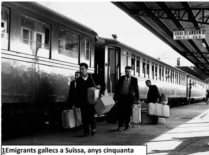
1 Emigrants gallecs a Suïssa, anys cinquanta

Fins mitjans segle XX, Espanya era un país d'emigrants. La manca de recursos feia que molta gent anàs a l'estranger a treballar.