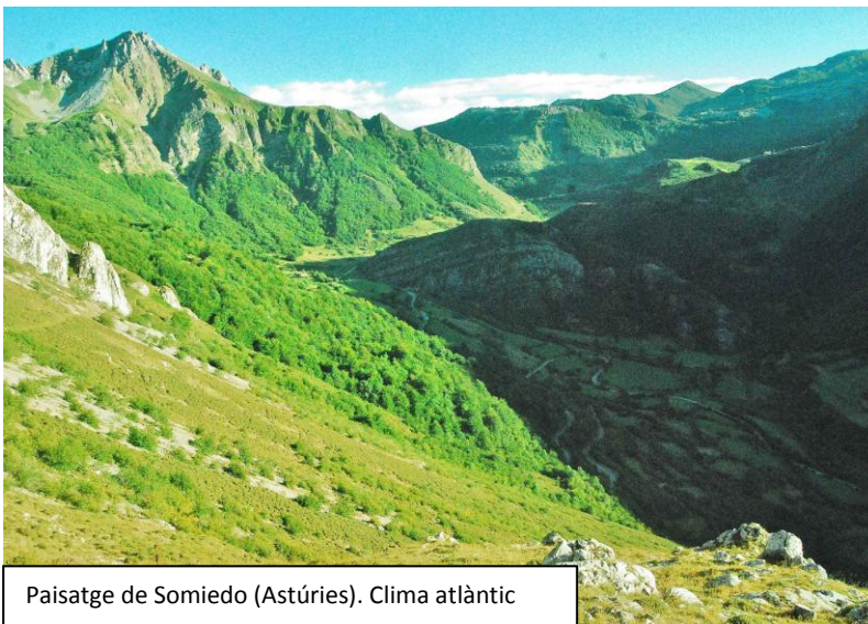
Paisatge de Somiedo (Astúries). Clima atlàntic

S'estenen per la franja oest del continent, sota la influència de l'oceà atlàntic. Les temperatures són suaus per influència del mar. Els estius i hiverns són humits i temperats, més frescs que al Mediterrani. Les pluges són abundants tot l'any.