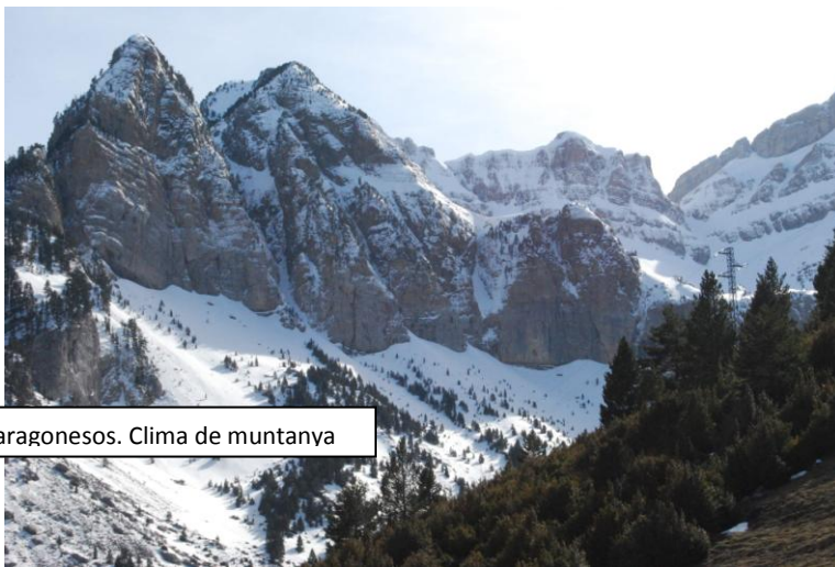
Pirineus aragonesos. Clima de muntanya

Es troben a les grans serralades europees. El clima és més fred a mesura que ascendim. La vegetació es distribueix en pisos, des del bosc de fulla caduca als estatges més baixos, els boscos de pi i avet de fulla perenne als estatges mitjans i les neus permanents del pis superior.