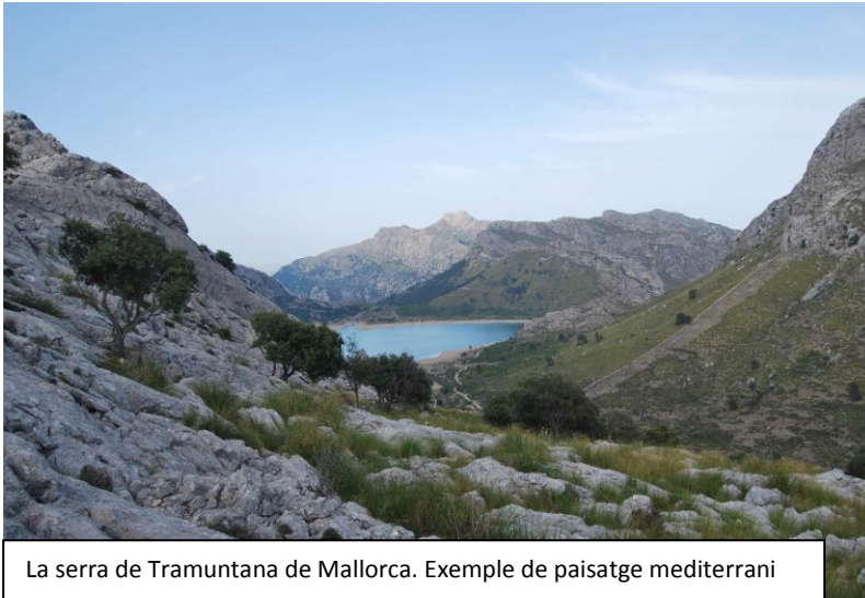
La serra de Tramuntana de Mallorca. Exemple de paisatge mediterrani

El continent europeu es situa entre les zones temperada i freda de les grans àrees climàtiques de la Terra. De sud a nord trobam gran varietat de climes: