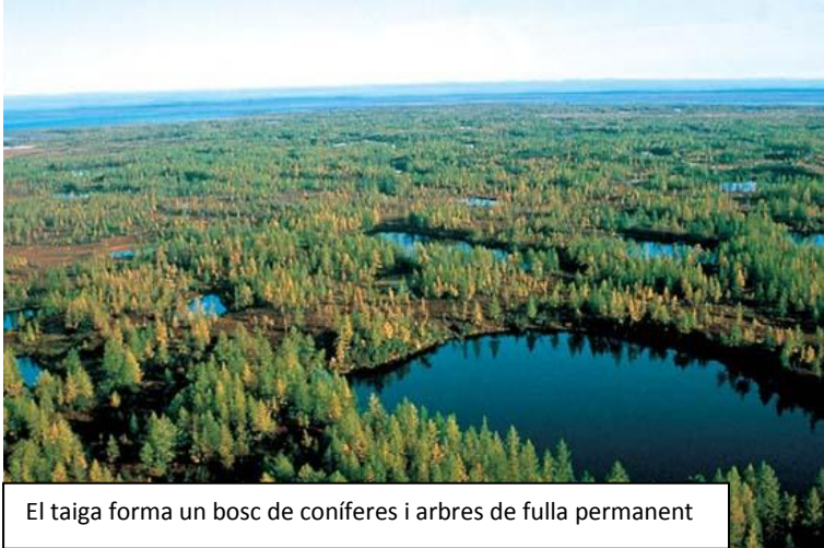
El taiga forma un bosc de coníferes i arbres de fulla permanent

El sector primari es basa en el cultiu del blat a la franja sud dels voltants del mar Negre i la ramaderia a les estepes de Rússia