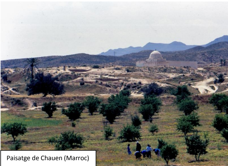
Paisatge de Chauen (Marroc)

Al llarg de la història s'han desenvolupat entorn el Mediterrani les tres religions monoteistes més importants: la jueva, la cristiana i la musulmana. Com a conseqüència, el mar ha estat l'escenari d'intercanvis i aportacions culturals molt importants.