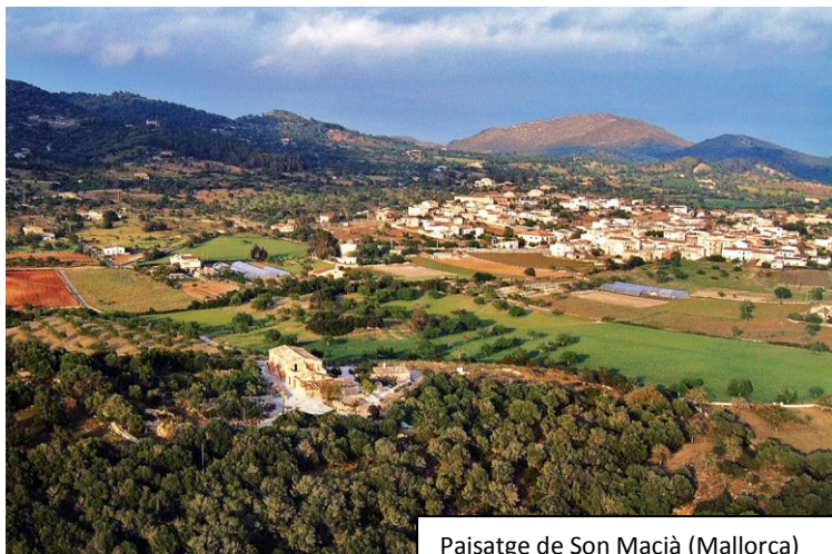
Paisatge de Son Macià (Mallorca)

Com a conseqüència, el paisatge típic del sud d'Europa, nord d'Àfrica i Proper Orient és el que es coneix com a "paisatge en mosaic", format per l'alternança de boscos, conreus, erms, i cases de pagès. Als costers de muntanya predominen els cultius en marjades de "paret seca"