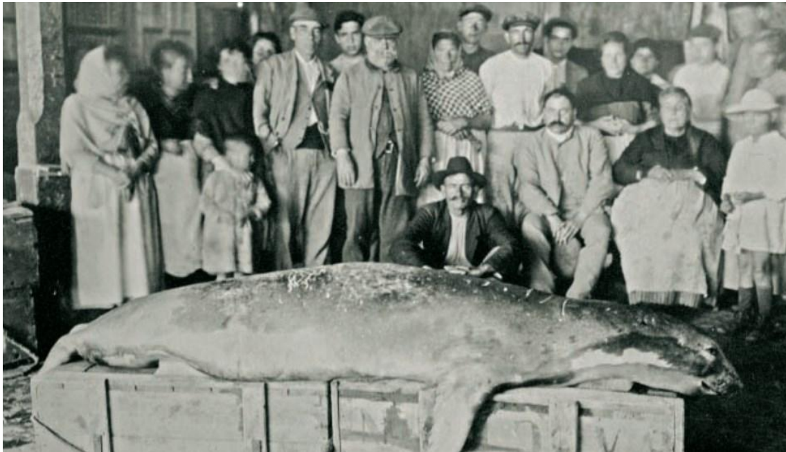
Vell marí capturat el 1922 a cala Fornells (Andratx)