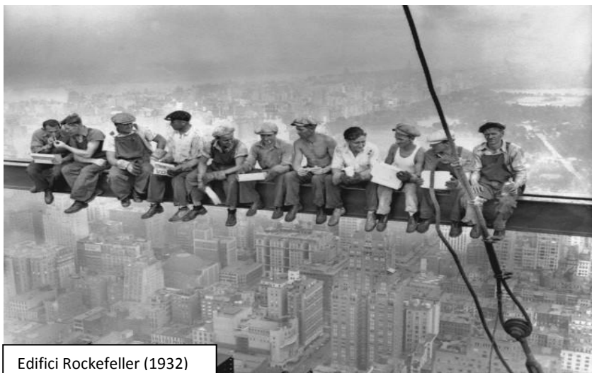
Edifici Rockefeller (1932)

Amb la revolució industrial es varen produir grans canvis. Com a conseqüència, els sectors secundari i terciari assoliren cada vegada més importància.