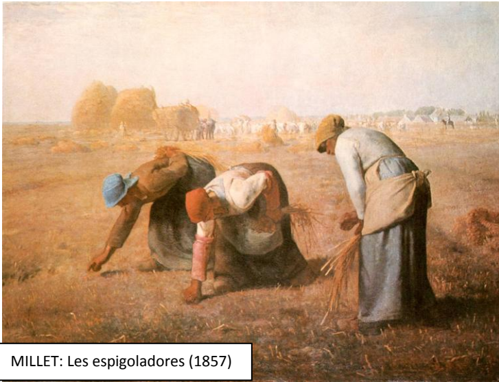
MILLET: Les espigoladores (1857)

A mesura que la societat s'ha anat especialitzant ha anat augmentant el nombre i la diversitat dels oficis. Per això, els diferents oficis i activitats econòmiques s'agrupen en sectors: