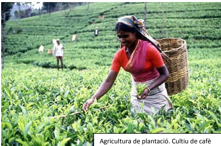
Agricultura de plantació. Cultiu de cafè

Es dediquen al monocultiu de productes com cafè, te, cacau, canya de sucre, destinats a l'exportació.