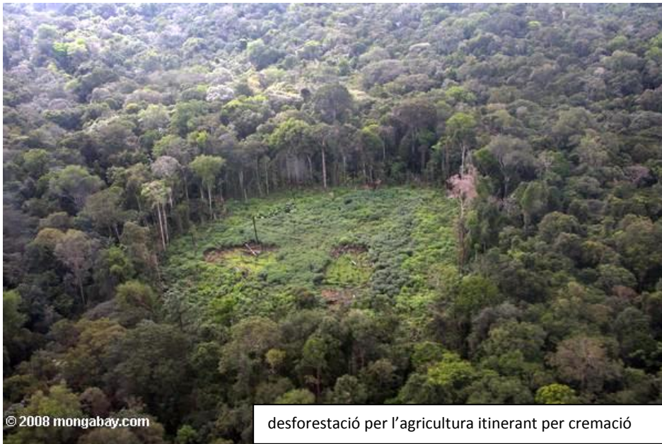
desforestació per l'agricultura itinerant per cremació

És el tipus d'agricultura més primitiu i es practica avui en dia a amples zones de les selves