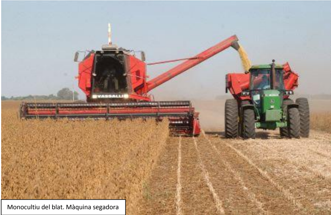
Monocultiu del blat. Màquina segadora

3.- Normalment s'utilitzen adobs químics, herbicides i fungicides. Els nutrients de la terra s'han de renovar. En ser una agricultura especialitzada que no es combina amb la ramaderia, no hi ha els fems naturals. Per altra banda, el monocultiu afavoreix l'aparició de les plagues, que obliga a la utilització de productes químics per a combatre-les.