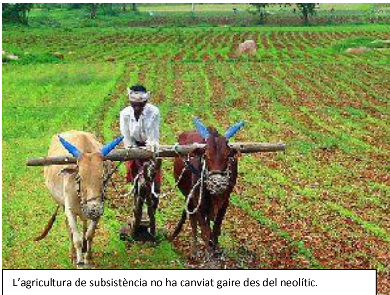
L'agricultura de subsistència no ha canviat gaire des del neolític.

Als pobles de la sabana es practica l'agricultura extensiva de secà, combinada amb la ramaderia, de manera que gràcies a l'adob que proporcionen els animals és possible una explotació permanent del sòl.