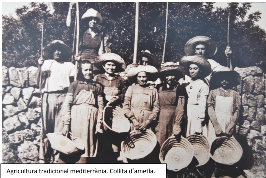
Agricultura tradicional mediterrània. Collita d'ametla.

La ramaderia tradicional normalment es combina amb l'agricultura, ja que el bestiar serveix per a produir adobs.