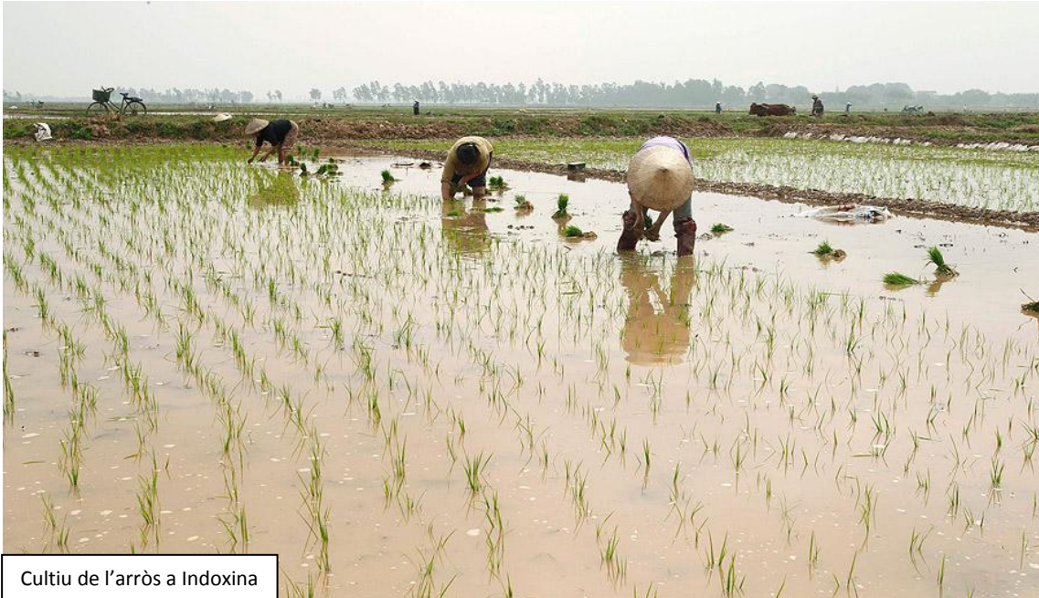
Cultiu de l'arròs a Indoxina

Es practica a tres grans zones: al voltant del riu Nil, entre els rius Tigris i Èufrates, i a diferents àrees de Xina, Indoxina i Índia.