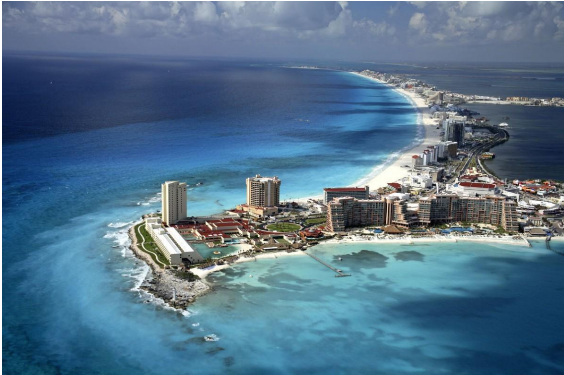
Cancún Beach (Mèxic)

8.- Amb el que has après del turisme mundial, comenta aquesta imatge (Descripció de la fotografia, tipus de paisatge, on està situat, com era abans, quin tipus d'oferta turística s'hi pot trobar, on és la població, és el lloc que visitaries o no i per què.....)