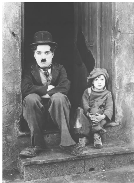
Charles Chaplin "The Kid" Els IDH no medeixen la pobresa dins el propi estat